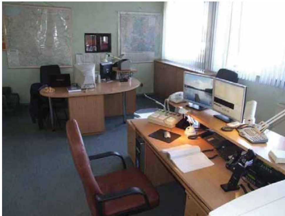
Zintegrowane Stanowisko Kierowania Powiatu Brodnickiego

Na przełomie roku 1999 i 2000 następuje zintensyfikowanie działań związanych z organizacją i wdrażaniem ratownictwa medycznego w ramach Krajowego Systemu Ratowniczo-Gaśniczego na obszarze powiatu. Wychodząc naprzeciw nowym zadaniom stawianym przed Państwową Strażą Pożarną Komendant Powiatowy w porozumieniu ze Starostą Brodnickim podjął decyzję o stworzeniu Zintegrowanego Stanowiska Kierowania (ZSK) pełniącego rolę Centrum Powiadomienia Ratunkowego i Powiatowego Stanowiska Kierowania Państwowej Straży Pożarnej. Do głównych zadań stanowiska miało należeć m.in. koordynowanie i zarządzanie siłami i środkami ratowniczymi powiatu oraz współpraca i koordynacja działań podejmowanych przez poszczególne służby. Zintegrowane Stanowisko Kierowania Powiatu Brodnickiego uruchomiono 2 lipca 2001 roku i funkcjonuje do dnia dzisiejszego łącząc pracę dyspozytora Państwowej Straży Pożarnej oraz dyspozytora medycznego.