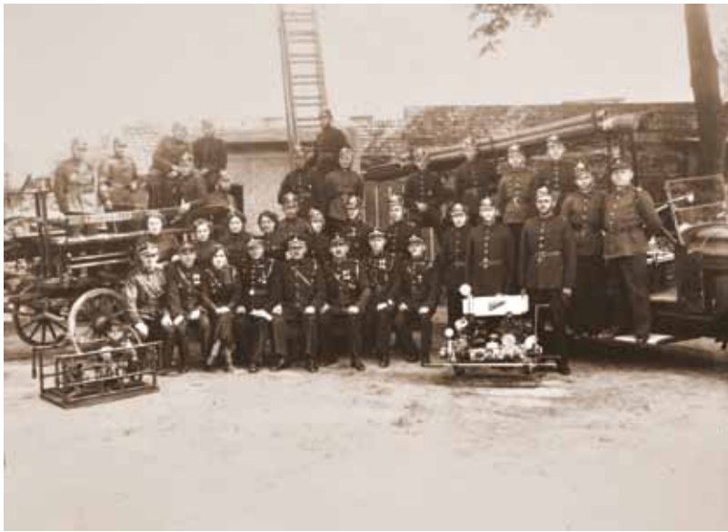
Zarząd i członkowie OSP w Brodnicy przed remizą na Starym Placu Szkolnym. Lata 30- te

Brodnicy powołano Ochotniczą Straż Pożarną w dniu 1 kwietnia 1862 roku. Z biegiem lat wzbogacała się ona w nowy sprzęt: w roku 1864 otrzymała ona trzecia sikawkę, a w roku 1885 – czwartą, w 1896 r. zakupiono 12-metrową wysuwaną drabinę, w 1910 roku – konny wóz strażacki. Dla OSP wybudowano przy murach miejskich na Starym Placu Szkolnym 5 remizę.