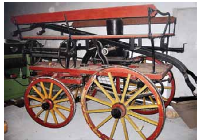
Cenną pamiątką przechowywaną od pokoleń jest sikawka ręczna do zaprzęgu konnego pochodząca z lat 20-tych. Dziś w zbiorach PSP Brodnica.