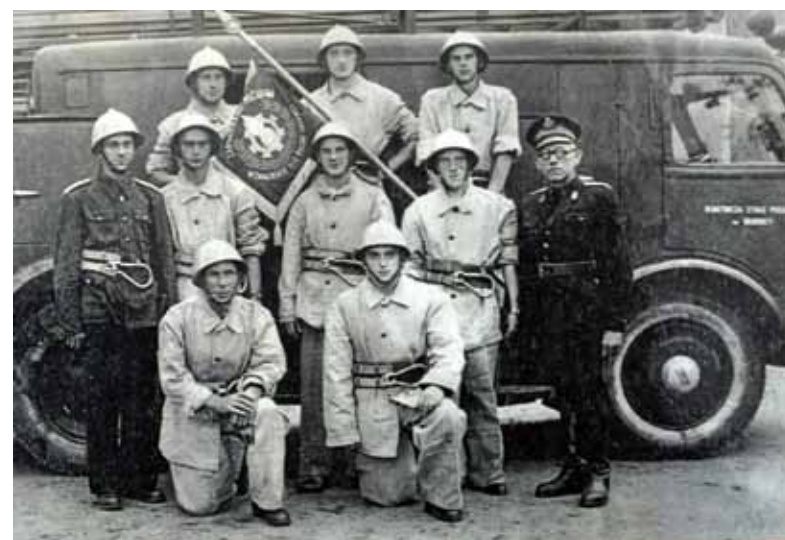
Strażacy z OSP w Brodnicy po zawodach wojewódzkich w Toruniu w roku 1954.

Pochwycili się z piekłem za bary, Pędzą z węzów dławiącą go ciecz.