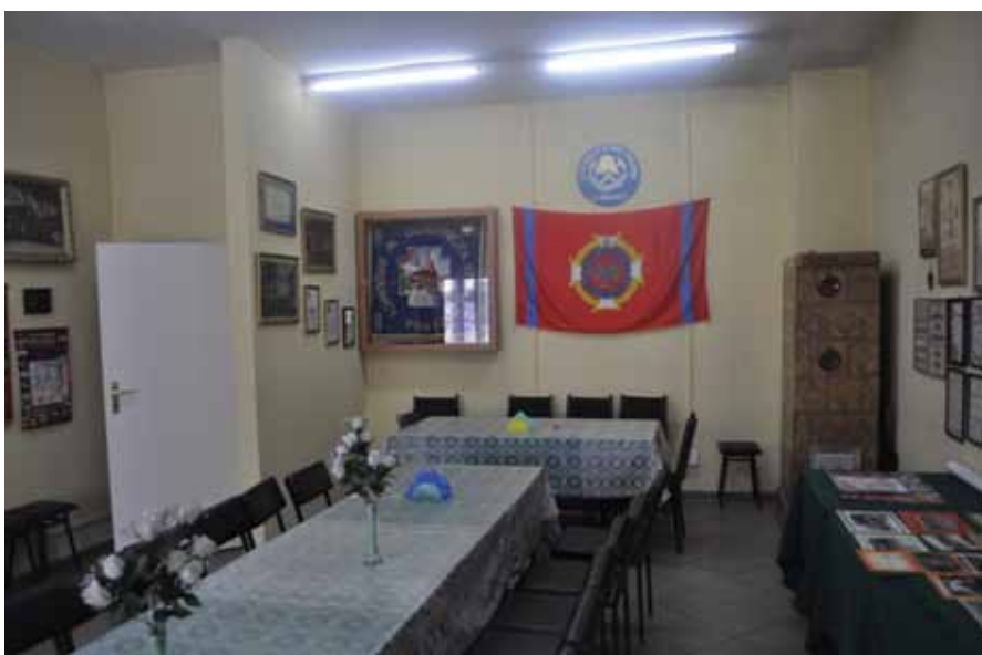
W siedzibie OSP druhowie przechowują m.in. sztandar oraz pamiątki