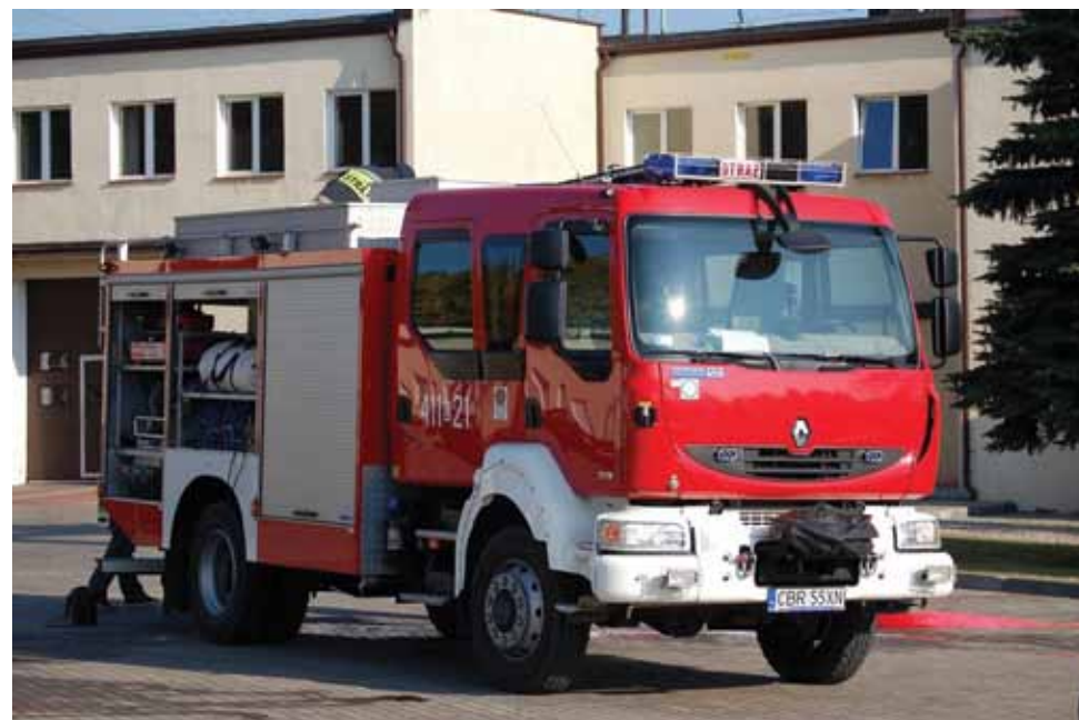
Średni samochód ratowniczo-gaśniczy z napędem terenowym GBA 2.5/16 Renault Midlum