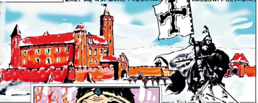
WIZERUNEK WERNERA VON ORSELN Z FRESKU KATEDRY W KWIDZYNIE

KNOWANIA WASALI WZBURZYŁY ŁOKIETKA. ZWOŁAŁ POSPOLITE RUSZENIE I W LIPCU 1327 R. KOMPLETNIE SPUSTOSZYŁ KSIĘSTWA WACŁAWA I TROJDENA. ZIEMIE WIZNENSKA, GDZIE RZĄDZIŁ SIEMOWIT ODDAŁ NA PASTWIE KSIĘCIU LITWY GEDYMINOWI, ZAŚ TEN DOKONAŁ TAM TAK POTWORNICH ZNISZCZEŃ, ŻE NA ICH WIDOK SIEMOWIT WKRÓTCE ZMARŁ ZE ZGRZYZOTY... PODOBNY LOS SPOTKAŁ WACŁAWA I TROJDENA.