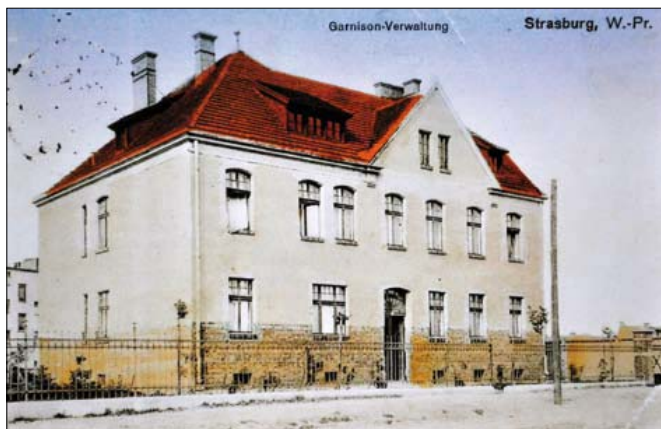
Widokówka sprzed I wojny światowej. Napis niemiecki: „Garrison-Verwaltung Straszburg W.-Pr.” /"Zarząd garnizonu. Brodnica PrusyZach."/

Pierwszą siedzibą RKU była „nowa plebania” /dziś wikariat ul. Farna 1a/.