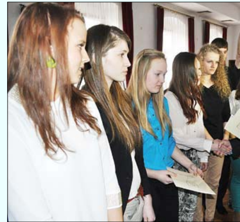
Burmistrz Jarosław Radacz wręcza stypendia