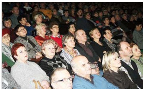
Publiczność oglądała i słuchała z dużym zacięciem

Ponad tysiąc osób obejrzało tegoroczny koncert noworoczny pod honorowym patronatem burmistrza Brodnicy. Widzowie oglądali mogli legendarny Zespół Pieśni i Tańca „Śląsk”.