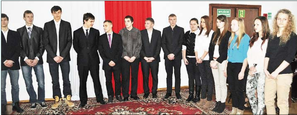
Brodniccy uczniowie, którzy otrzymali stypendia sportowe