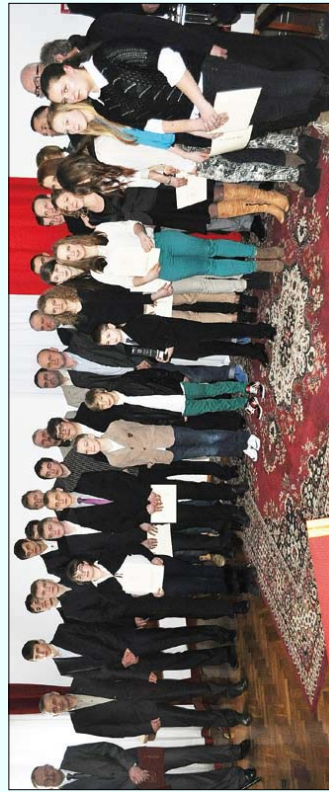
Na koniec uroczystości wszyscy bohaterowie gali zapowiadali do wspólnego zdjęcia

ubiegłym roku zdobywali w różnych dyscyplinach cenne trofea i medale. Mistrzostw Polski. Z tej okazji nagrodzonych uczniów brodnickich szkół. Listę uczniów prezentujemy obok.