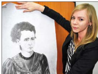
Autorka z rysunkiem Marii Skłodowskiej Curie