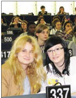
W siedzibie parlamentu podczas debaty młodzieży

Uczniowie klasy trzeciej Technikum Ekonomicznego z Zespołu Szkół Zawodowych w Brodnicy zostali laureatami konkursu internetowego Eurocola sprawdzającego wiedzę o Unii Europejskiej.