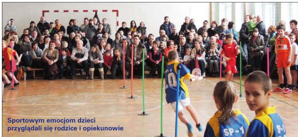
Sportowym emocjom dzieci przyglądali się rodzice i opiekunowie