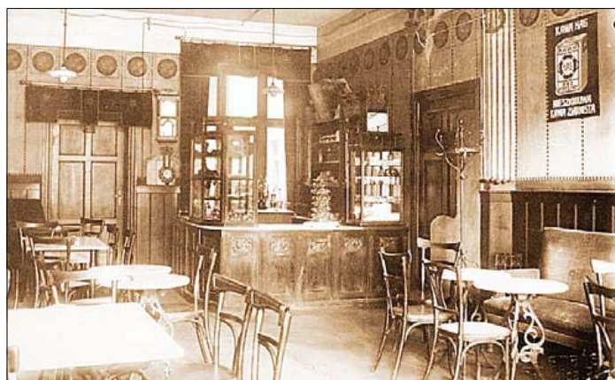
Lokal u Szwarca. Duży Rynek 33. Dziś sklep Waldi

San Marco to arka Noego, gdzie znajduje się miejsce – bez przywilejów ani wykluczeń zarówno dla par szukających schronienia przed deszczem, jak i dla samotnych. (...) W San Marco, triumfuje krwista i pełna życia różnorodność. Stare wilki morskie, studenci szykujący się do egzaminów i obmyślający miłosne strategie, szachiści obojętni na wszystko