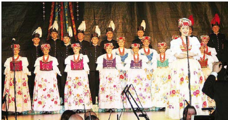
Zespół zachwycał tańcem i pięknymi strojami oraz mistrzowskim wykonaniem piosenek