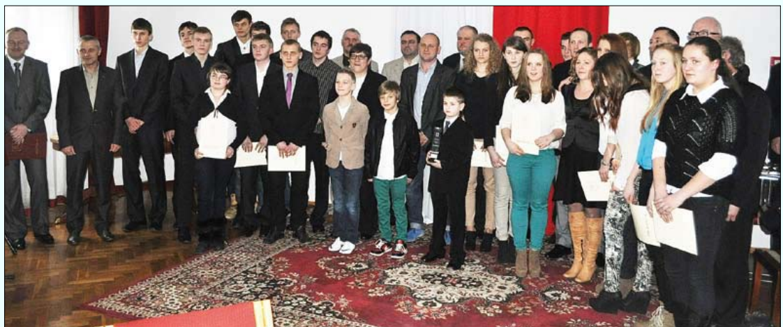
Na koniec uroczystości wszyscy bohaterowie gali zapozowali do wspólnego zdjęcia