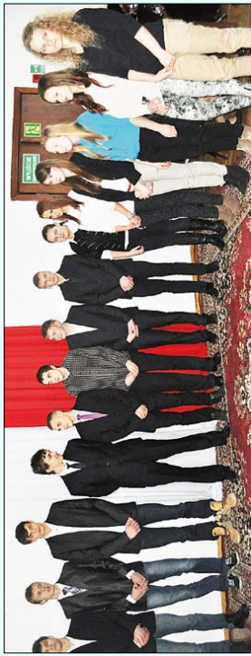
Brodniccy uczniowie, którzy otrzymali stypendia sportowe