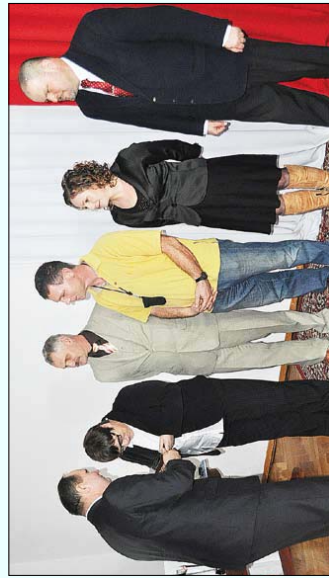
Wyodrębnionym nauczycielom nagrody wręczył poseł Zbigniew Sosnowski