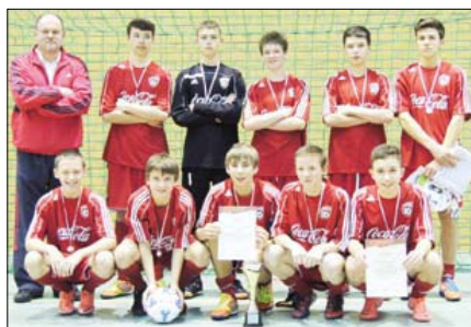
Zespół Brodnicy 1, choć uległ w finale piłkarzom z Gąlczewa zastąpił na uznanie